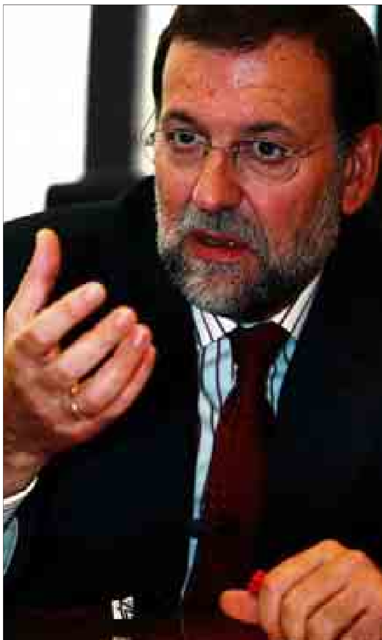
Mariano Rajoy, en la sede del PP, durante la entrevista con EL MUNDO.

RESPUESTA.- No estamos ante una reforma del Estatuto, sino ante una reforma de la Constitución, ante una ruptura del consenso de la Transición, ante un cambio del modelo de Estado y ante una liquidación, impulsada por el Partido Socialista, del principio de igualdad entre los españoles. A partir de ahora, los políticos de Cataluña podrán decidir sobre el futuro de todos los españoles, pero las Cortes Generales no podrán decidir nada sobre lo que ocurra en Cataluña. Sigue en página 8 Editorial en página 3